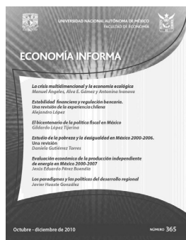
Economía Informa, Núm. 365 octubre-diciembre de 2010