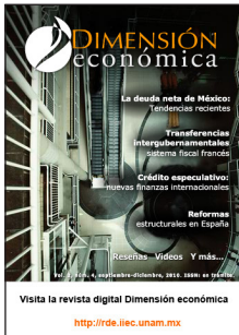
Dimensión económica, Número 4, vol. 2 .