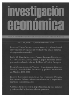
Investigación Económica, Vol. LXX, núm. 275, enero-marzo de 2011